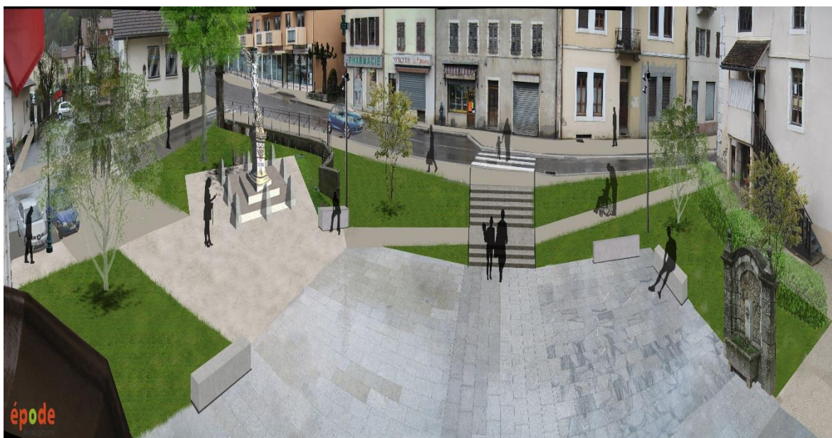
Planning prévisionnel des travaux (mise à jour mi-mars) :

Esquisse des travaux à ce jour. Au vu des délais de commande des pierres et des dates de réalisation des travaux le déplacement du monument aura lieu entre juillet et octobre 2018, son inauguration se déroulera lors de la cérémonie du 11 novembre 2018.